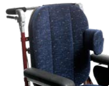
Bålstöd vinkelställbart, kort ger stöd både från sidan och framifrån.