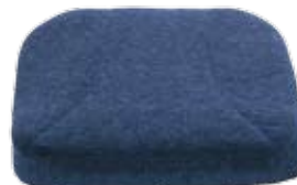
Sittdyna original med inkontinensklädsel.