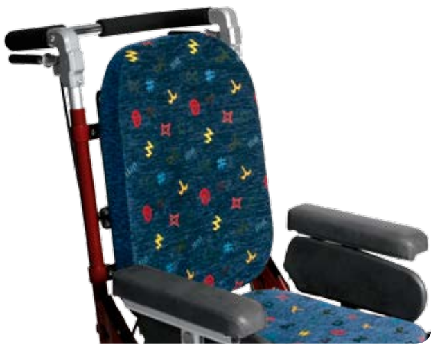
Ryggbricka med Standardryggdyna.