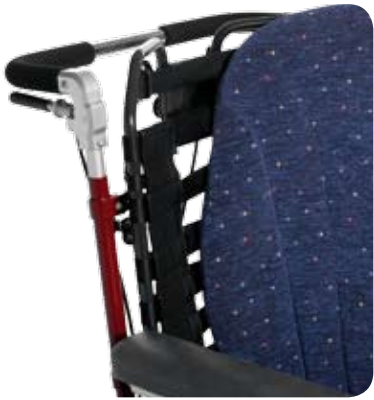
Flexi Ryggssystem med Flexiryggdyna.