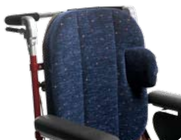
Bålstöd, litet, med U-bygel.