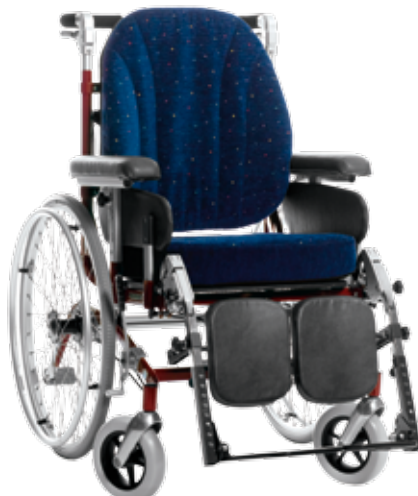
HD 500 24" hjul