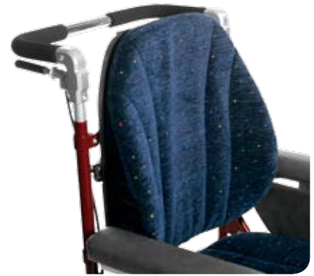
Ryggbricka med Formryggdyna. Även förlängt utförande +10 cm.

Ryggen kan regleras i höjd 6 cm. Flexi Ryggssystem går att höja och sänka separat 6 cm eller i kombination med infästningen i rullstolen hela 12 cm totalt.