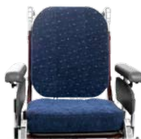
Sitsbreddning + 5 cm.

Tillbehörens klädsel är enfärgat blå alternativt svart Dartex. Alla klädsel på dynor och tillbehör är avtagbara och tvättbara. Tvättråd 60° C.