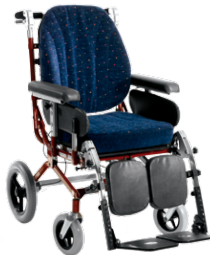
HD 600 12" hjul