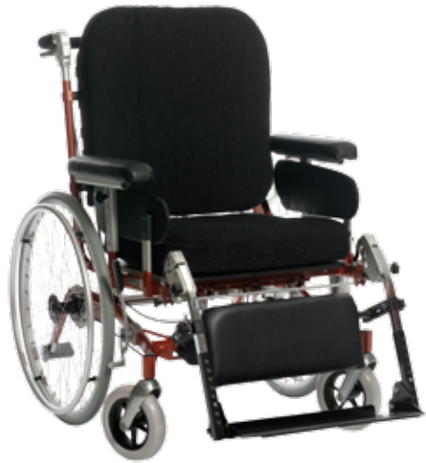
Humlan HD 500 24" hjul