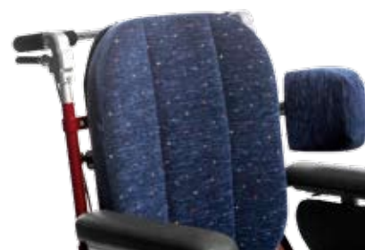
Bålstöd, stort, med L-bygel.