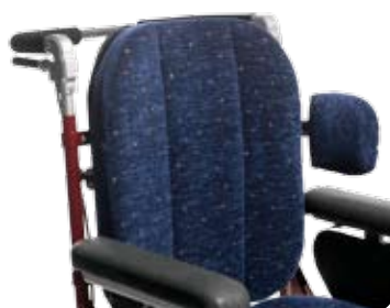
Bålstöd, litet, med L-bygel.