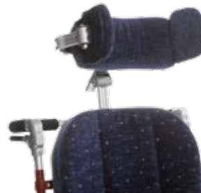
Nackstöd, enligt ovan, med 1 eller 2 sidostöd.