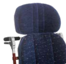
Ryggförlängare ökar ryggstöds-höjden 24 cm.