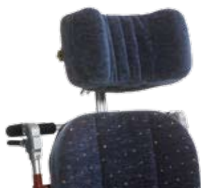
Huvudstöd, ställbart i höjd, vinkel och djup.