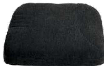
Sittdyna original med standardklädsel.