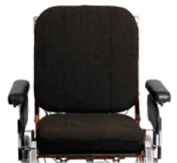
Sitsbreddning + 10 cm.