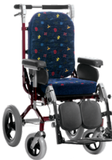
HD 600 12'' hjul