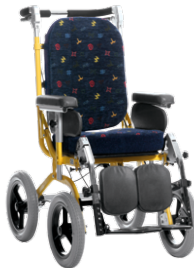
HD 800 4 x 12'' hjul