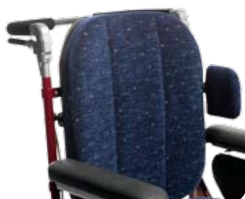
Bålstöd, litet, tunt, med L-bygel.