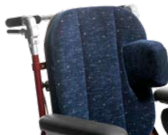
Bålstöd, stort, med U-bygel.