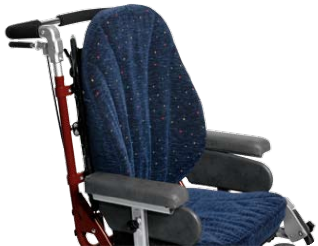
Flexi Ryggssystem med Flexiryggdyna (Obs! Vuxen Flexirygg, sb 38).

Ryggen kan regleras i höjd ca 6 cm. Flexi Ryggssystem går att höja och sänka separat 6 cm eller i kombination med infästningen i rullstolen hela 12 cm totalt.