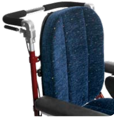
Ryggbricka med Standardryggdyna. Även förlängt utförande +10 och 20 cm.