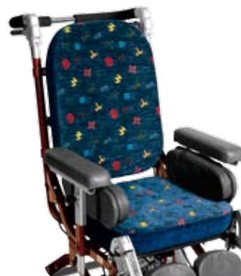
Utfyllnadskuddar - 6 cm.