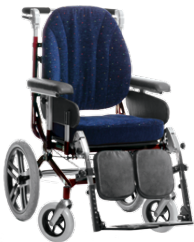
HD 650 16" hjul