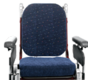
Sitsbreddning + 10 cm.