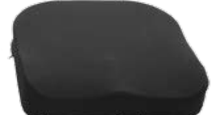
Sittdyna Step2 med inkontinensklädsel, Dartex.