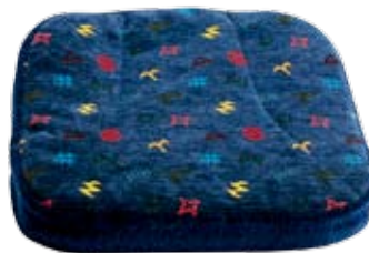
Sittdyna original med standardklädsel.