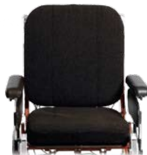
Sitsbreddning + 5 cm.

Stolens och tillbehörens klädslar är svarta alternativt i svart Dartex. Alla klädslar på dynor och tillbehör är avtagbara och tvättbara. Tvätträd 60° C.