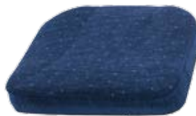
Sittdyna original med standardklädsel.

Sittdjupet är reglerbart mellan 46 - 55 cm. Inställningen görs med ett enkelt handgrepp på sitsens bakkant. Som alternativ finns förlängt sittdjup +5 cm.