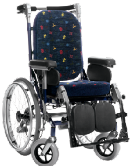
HD 500 20'' hjul