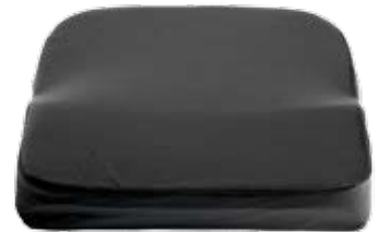
Sittdyna original med inkontinensklädsel, Dartex.

Standard benstöd med helt fot- och vadvstöd. Benstöden kan vinklas stegvis från ca. 105° - 140° knävinkel. Alternativa ben-, fot- och vadvstöd finns, se tillbehör.