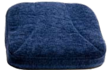
Sittdyna original med inkontinensklädsel.