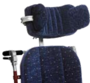
Huvudstöd, enligt ovan, med 1 eller 2 sidostöd.