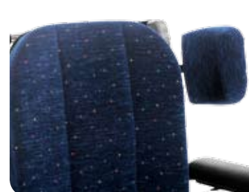
Axelstöd ger stöd mot överarmen.