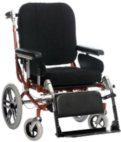
Humlan HD 650 16" hjul