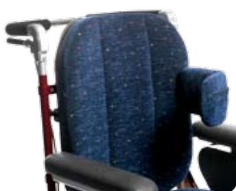
Bålstöd vinkelställbart, lång ger stöd både från sidan och framifrån.