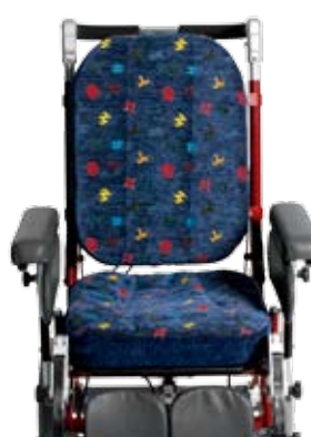
Sitsbreddning + 5 cm.

Tillbehörens klädsel är enfärgat blå. Alla klädslar på dynor och tillbehör är avtagbara och tvättbara. Tvättråd 60° C.