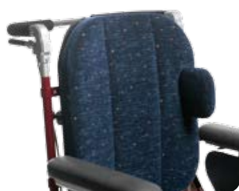
Bålstöd, litet, tunt, med U-bygel.